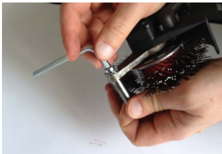
Remove the Accelerator Bar Beschleunigungsstab entfernen

ACHTUNG: Vor der Demontage/Montage das Gerät immer von der Luftdruck- bzw. Stromversorgung trennen!