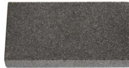
Reshaping stone, Art.no. ZU-003

Bristle Blaster® Belts can be resharpened, using the MONTI Reshaping Stone, Art.-No. ZU-003.