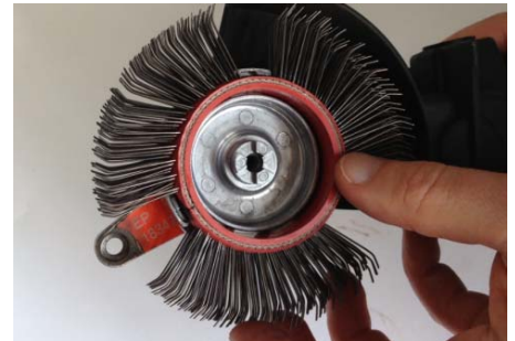
Remove the belt and reverse the running direction. Reinstall into the Adaptor System. Bristle Blaster® Band in umgekehrter Laufrichtung einlegen. Aufnahmesystem wieder schließen.