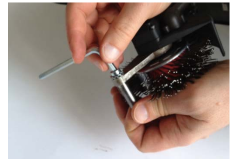
Remove belt and reinstall in correct running direction into Adaptor System. Reinstall Accelerator Bar Bristle Blaster® Band wieder in korrekte Drehrichtung einlegen und Beschleunigungsstab anbringen.

Note: Resharpener is usually possible up to a maximum of two times. Please note that while resharpening the bristle will become shorter with each resharpening. If the bristles become too short, they will not reach the Accelerator Bar properly, which will lead to reduced efficiency.