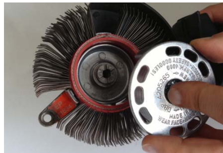
Open the Adaptor System Aufnahmesystem öffnen.